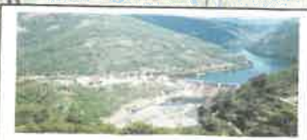
PINET commune VIALA DU TARN